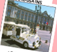
LE PETIT TRAIN

En début d'après-midi, balade au cœur de la ville rose en petit train touristique pour découvrir la place du Capitole, la basilique Saint Sernin, les hôtels particuliers... Temps libre ensuite pour profiter du centre toulousain.